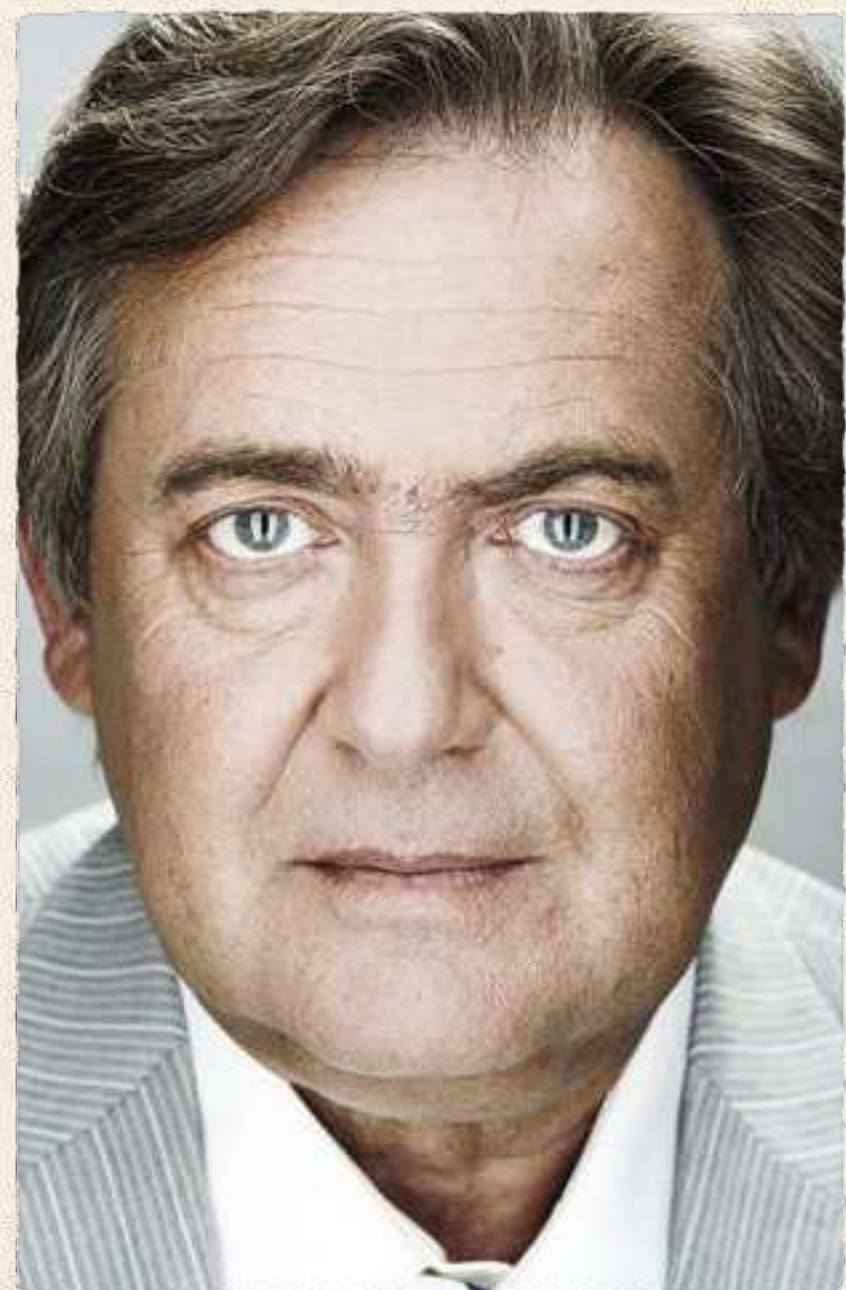
ГЕНЕРАЛЬНЫЙ ЮРИЙ СТОЯНОВ