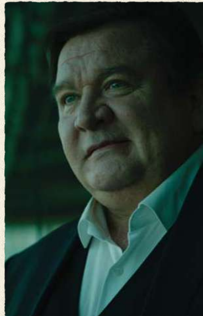
СУРОВ РОМАН МАДЯНОВ